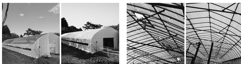
〈左〉牛舎修繕前 強風で飛ばされる 〈右〉牛舎修繕後