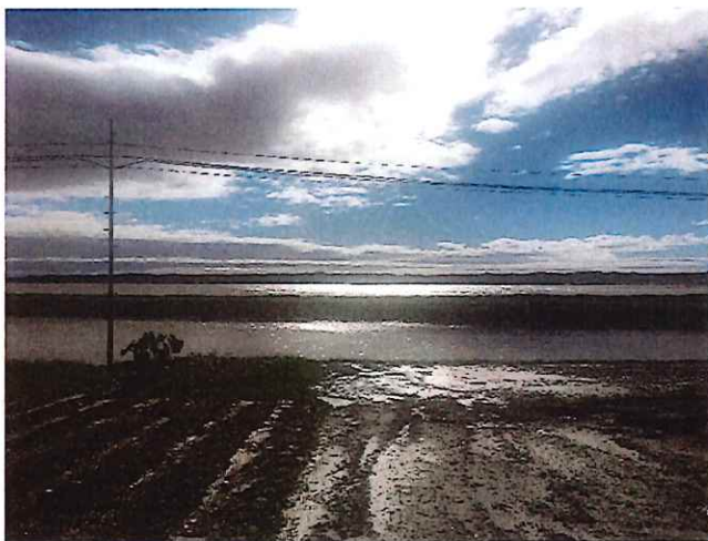
冠水により「わ・は・わ大郷」には入れず