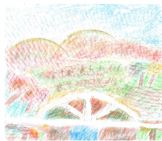
わ・は・わ田尻 高橋正彦 紅葉 鳴子