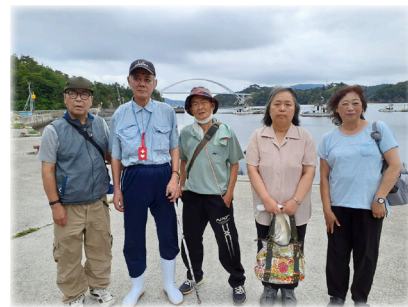
☆女川出島大橋を見てきました☆

美里町地域活動支援センターは、地域で生活をする障害のある方が、日中安心して交流や活動に参加できる場を提供しています。定期的に通所することで生活のリズムを整えながら、体力やコミュニケーション力等をつけ、地域社会との交流が図られるよう様々な活動を行っています。9月から新規利用者1名を迎え、現在11名の方が利用登録されています。外出することを楽しみにしている方が多く、月に1度外出レクリエーションの機会を設け、皆さんから行き先の希望を挙げてもらい、最後は多数決で決めています。月2回ボランティアのかけはしさんに来ていただき、会話をしながら一緒に手芸品作りを手伝ってもらい、また最近では宮城県障害者スポーツ協会から登米市在住の障害当事者の方を講師として招き、ポッチャ体験を行い、様々なことを教えていただく貴重な交流の機会となっています。今後も地域の方々との交流を深め、繋がりを大切に活動していきたいと思ひます。