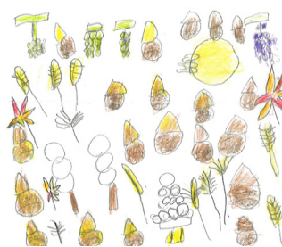
わ・は・わ広瀬 渡辺真帆 秋